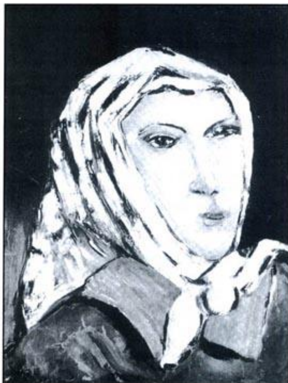
Quadre de Jacint Salvadó, (1924).

«En aquests mesos a Barcelona, vaig retrobar el