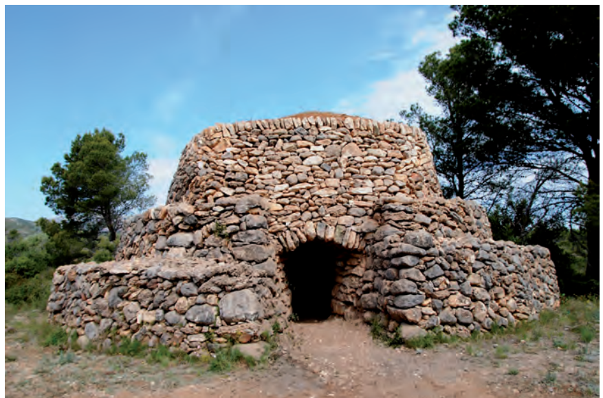
■ Vista frontal de la barraca del Jaume de la Cota. J. Gironès, a L'art de la pedra en sec a les comarques de Tarragona , l'anomena la «catedral» de les construccions rurals obrades amb pedra seca.

Per permetre la vida de les persones, les barraques i les cabanes necessitaven uns complements gairebé imprescindibles, algun dels quals també es bastien amb pedra. Són els armaris i les neveres, que se situaven a la part més frescal de les construccions, on es podien deixar els queviures amb un mínim de condicions ambientals. També els animals