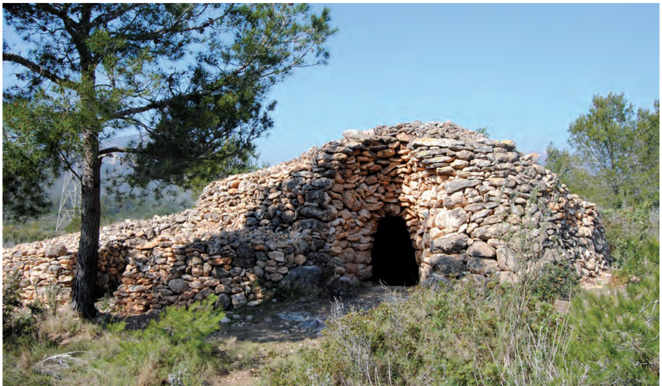
■ Exterior de la barraca del Miquel Terna. Hi destaca el portal, amb muntants arquejats acabats en arc de mig punt, que abasta tota l'amplada de les parets. Al seu interior, de planta circular, el sòl és una gran llosa de pedra que fa baixada des de l'exterior, conformant una mena d'aljub per recollir l'aigua de la pluja. La façana es perllonga, pel costat esquerre, en un cos més baix de planta semioval, que inclou una dependència de planta rectangular que en una fotografia de 1967 s'observa que estava coberta; encara ara, al fons, s'hi aprecia una mena de banquetja de pedra o menjadora.

Santa Marina és la patrona del Pratedip. Se celebra el 18 de juliol. Té una bonica ermita a uns dos quilòmetres més enllà d'aquell poble en direcció al coll de Fatxes.