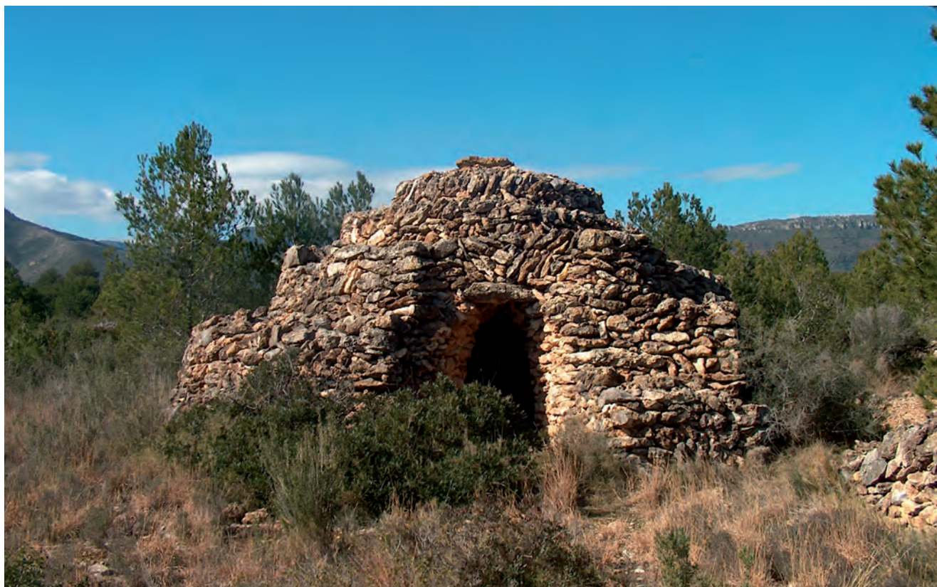
■ Barraca en espiral. La seva forma helicoidal facilita l'accés a la gran pedra cobertora que corona el sostre, que és practicable, fet que permetia l'evacuació directa del fum en cas d'encesa de foc a l'interior. La façana presenta un portal d'arc d'ametlla amb muntants arquejats i una llinda. La coberta és de cúpula i el recobriment de pedruscall.

besavis van veure construir barraques, ens fa suposar que la majoria de les de Mont-roig deu ser de mitjans o finals del segle XIX. Això també encaixa amb la teoria general sobre les barraques del Camp de Tarragona.