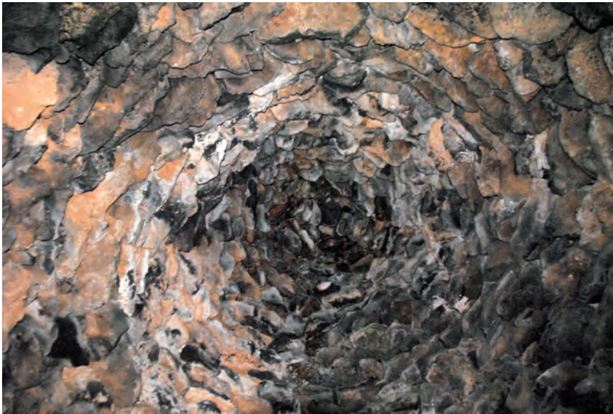
■ La coberta de la cabana dels Comuns del Pellicer arrenca amb falsa cúpula i acaba en cúpula.

tera, desnivell significatiu...). Aquesta declaració, més enllà de la protecció d'aquests elements en concret, ha de servir per posar en valor les construccions en pedra seca de tot el país, un patrimoni encara força desconegut per al gran públic i majoritàriament en perill de desaparició. ■