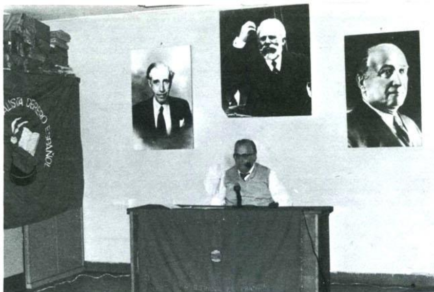
«ENTRE LA ESPERANZA Y EL FRAUDE», DE LA COOPERATIVA DE CINE ALTERNATIVO.