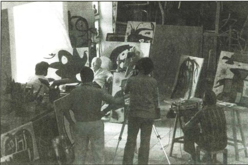
L'estudi-taller de Joan Miró