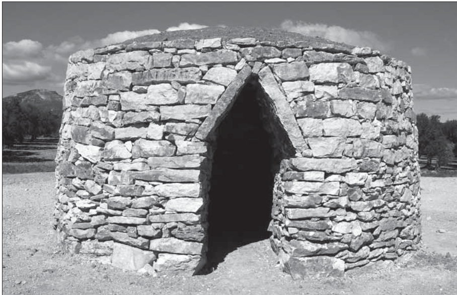
Barraca de nova construcció (març del 2006) feta a la rotonda de l'encreuament de la T-323 (carretera de la mar), la urbanització Club Mont-roig i el camí de les Arenes.