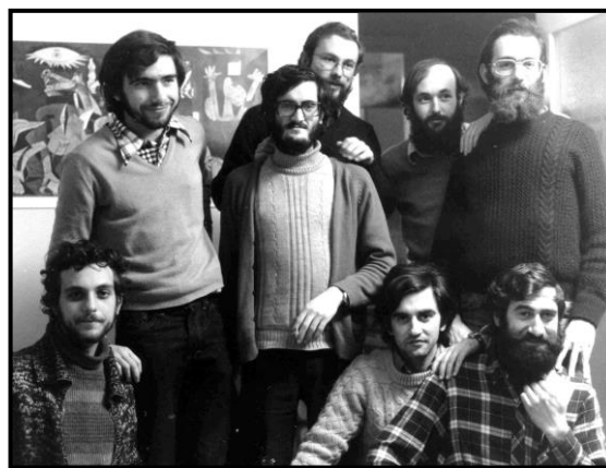
Grup de Can Serra