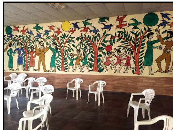
Mural de Jordi Maragall (1975)

Fou una trobada plena d'emoci3n revivint aquells mesos del 1975, amb el franquisme a les acaballes i del propi Franco, allitat des d'aquells infarts de finals d'octubre. Es vivien temps dif3cils i alhora esperançadors. Alg3u va remarcar que aquells objectors